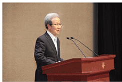
程永华常务副会长

创价大学第55届“创大节”于2025年10月11日拉开帷幕。当天在创价大学池田纪念讲堂隆重举行了开幕活动“纪念庆典”，曾任中国驻日大使的中日友好协会常务副会长程永华先生等嘉宾出席。程常务副会长作为中日邦交正常化后首批中国政府公派留学生曾在创大求学。