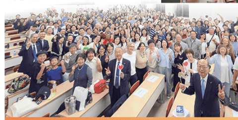
第3回創大留宝会総会 3rd Ryugakusei Alumni Gathering Meeting 2025.10.11